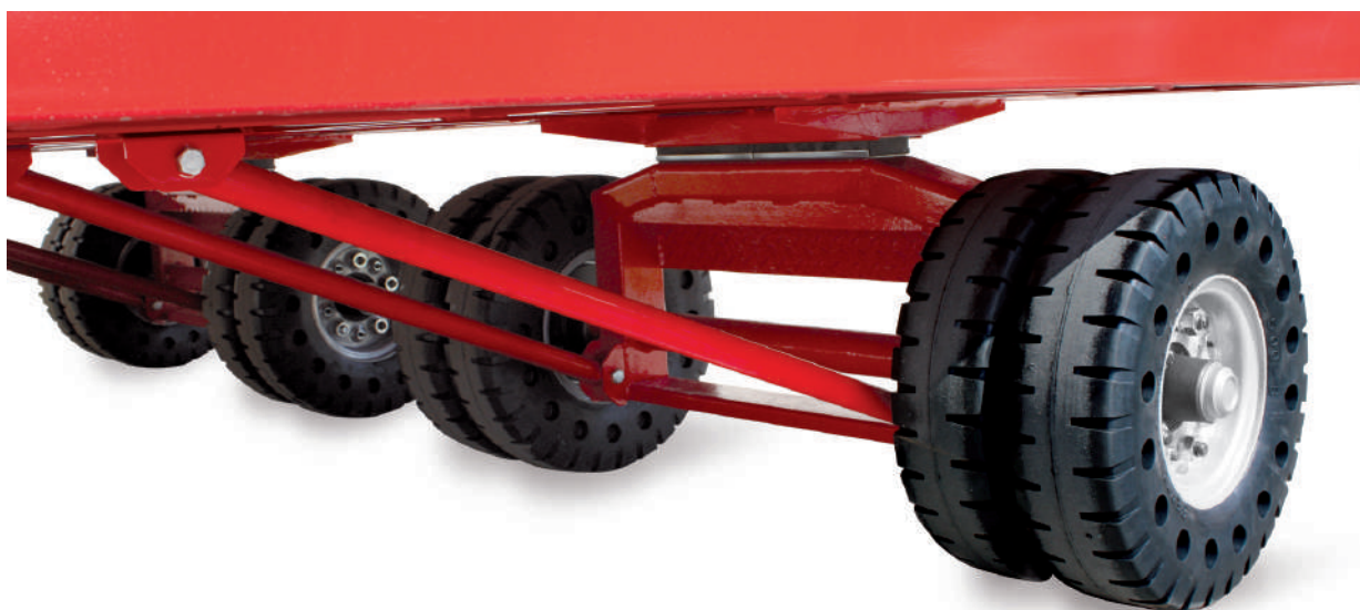
MOD. 43-RRISE - Sospensione posteriore