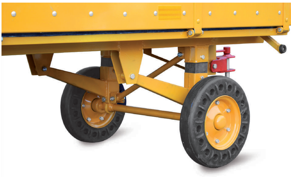
MOD. 93-S7 - Sospensione posteriore